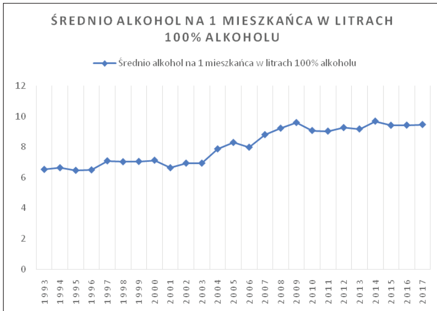
Rys. 1. Średnio alkohol na 1 mieszkańca w litrach 100% alkoholu w latach 1993-2017.

Źródło: Opracowanie własne na podstawie http://www.parpa.pl/index.php/badania-i-informacje-statystyczne/statystyki , dostęp 21.10.2018.